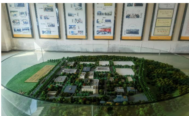
图 3. 专家一行在酉阳药厂实地考察