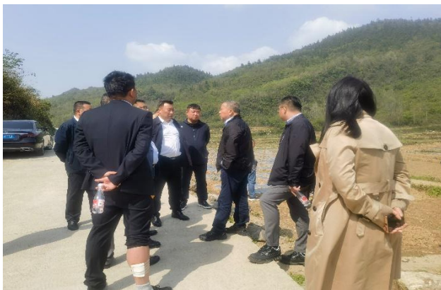
图 1. 专家一行在油茶种植基地实地考察

包括村民经济来源、家庭收入、生活环境、健康状况以及地质与气候条件、土地分布、农作物生长情况、村民诉求等，并对油茶种植基地、大黄种植基地、酉阳县制药厂等基地进行了实地考察调研，并向乡镇领导和村民详细了解情况，见图片 1-4。