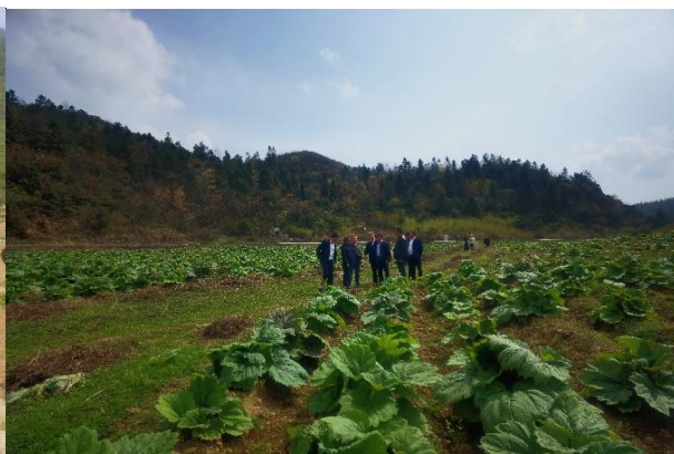
图 2. 专家一行在大黄种植基地实地考察