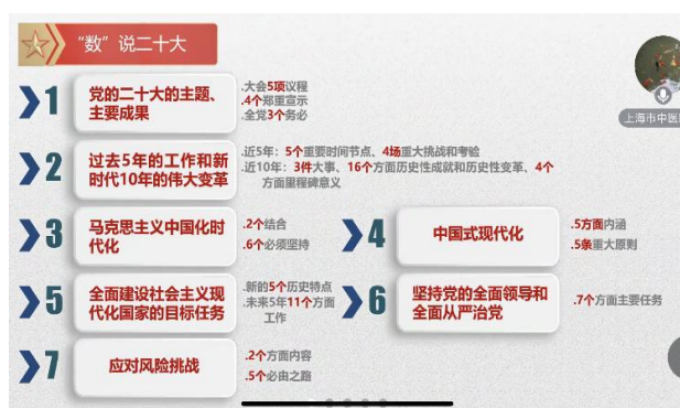
图 3. 陆书记的党课展示了七方面内容