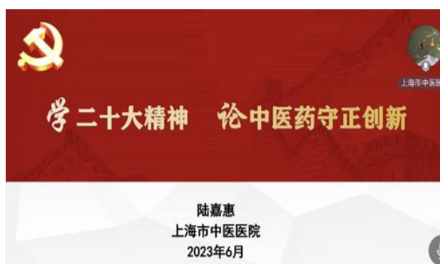
图 1. 2023 年二季度党课主题

会议结束，中华中医药学会血液病分会党小组组长陈信义、分会秘书长田劭丹教授，先后对今天的党课进行了总结和评价，一致认为，陆嘉惠书记的党课准备充分，内容丰富，重点突出，紧扣党的十二大精神，又对中医药守正创新提出了具体思路，与会同志深受启示，真正起到了党建促进业务发展的作用。同时，要求参会的同志，会后做好会议精神传达学习，为血液病中医药守正创新发展工作多作贡献！