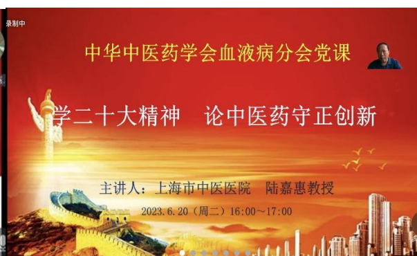
图 2. 血液病分会党小组副组长主持会议