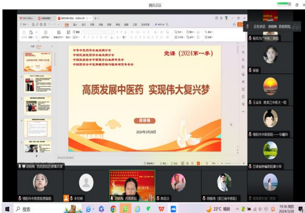
图 1. 2024 年第一季度党课教育题目

核心内容：通过党课学习，激励分会全体党员与积极分子热爱中医、实践中医、发展中医、爱岗敬业的热情，教育全体党员与积极分子认真做好中医的传承、创新、发展的各项工作，为实现中华民族伟大复兴的中国梦贡献力量。