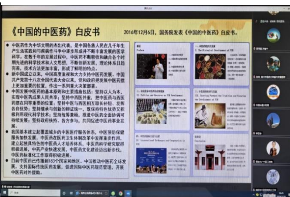
图 8. 中国的中医药白皮书相关内容

党课结束时，中华中医药学会血液病分会主任委员侯丽教授针对胡晓梅教授讲课内容发表感言（见附录文字材料）。与会党员与积极分子纷纷谈到：中医药作为我国的传统医学，具有独特的优势和价值。中医强调整体观念和辨证论治，注重预防保健和康复养生，与西医的药物治疗形成了良好的互补。同时，中医药还具有成本低、副作用小、适合长期使用等优点，可以为医保节省大量的资金。通过党课学习，激励分会全体党员与积极分子热爱中医、实践中医、发展中医、爱岗敬业的热情，教育全体党员与积极分子认真做好中医的传承、创新、发展的各项工作，为实现中华民族伟大复兴的中国梦贡献力量。在听取参会专家充分讨论后，中华中医药学会血液病分会名誉会长与党小组组长、中国民族医药学会血液病分会会长、中华中医药学会血液病创新研究与转化平台主任陈信义教授进行了总结，并号召中华中医药学会血液