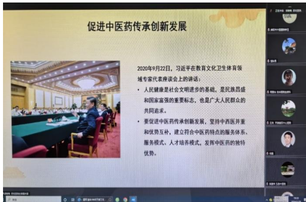
图 7. 习总书记关于促进中医药传承论述