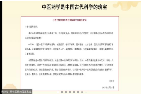
图 6. 习总书记给中国中医科学院的贺信