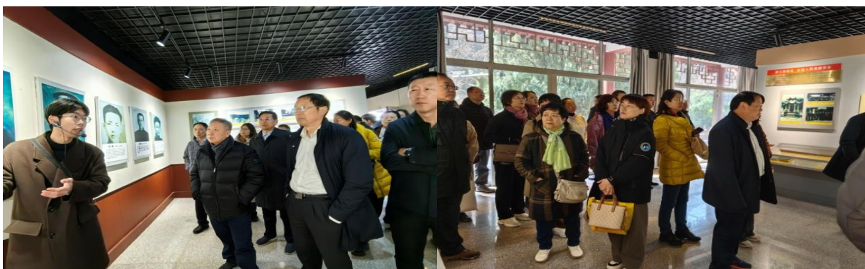
图 15. 党员在烈士纪念馆接受微党课教育 2 图 16. 党员在烈士纪念馆接受微党课教育 3