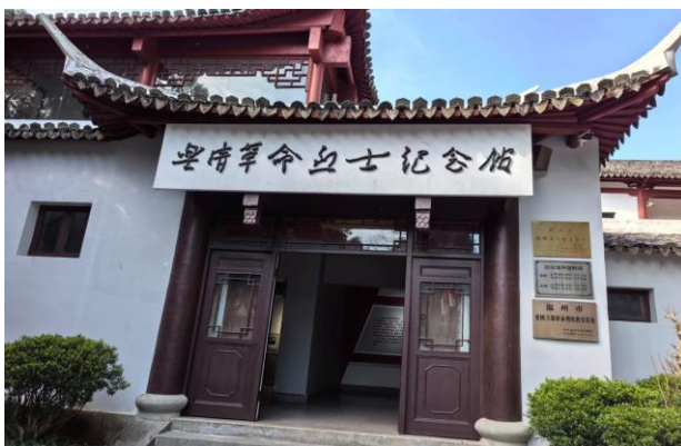
图 13. 雁荡山乐清革命烈士纪念馆

雁荡山革命烈士陵园位于浙江乐清市雁荡镇响岭头村。乐清是老革命根据地，有着悠久而光荣的革命斗争历史。早在大革命时期就创建了中共乐清地方党组织。在中国共产党的领导下，乐清人民前赴后继，不惜抛头颅洒热血，英勇抗争，为了夺取新民主主义革命在乐清的伟大胜利，谱写了可歌可泣的动人篇章。为了缅怀革命先烈，1951年12月，中共乐清县委、乐清县人民政府开始在雁荡山响岭头村动工兴建雁荡山革命烈士墓，1953年7月竣工。后几经修缮扩建，1963年4月建成雁荡山革命烈士纪念碑，1995年6月建成乐清革命烈士纪念馆，形成雁荡山革命烈士陵园。在这肃穆幽静的陵园里，安息着400多位各个历史时期牺牲的浙东南地区的革命烈士。纪念碑旁边的纪念馆是一座二层楼仿古建筑，门厅为前言，左右两侧是毛泽东和邓小平的手书，四个展厅分成五四运动与大革命时期、土地革命时期、抗日战争时期、解放战争和社会主义建设时期四个部分布展，同时陈列了大量的革命文物。整个展览史料翔实，事迹感人，图文并茂，形象鲜明，堪为一部生动感人的爱国主义和革命传统教育的史诗（13-16）。