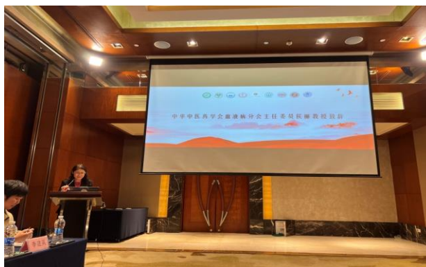
图 5. 主任委员侯丽教授致开幕词