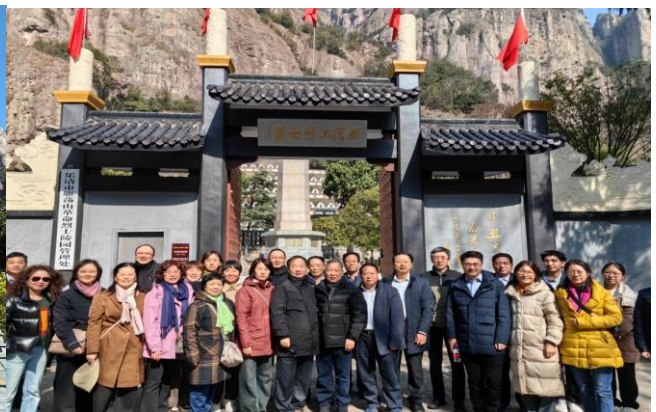
图 12. 党建活动代表在烈士陵园前合影缅怀