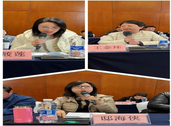
图 8. 与会代表认真讨论工作报告