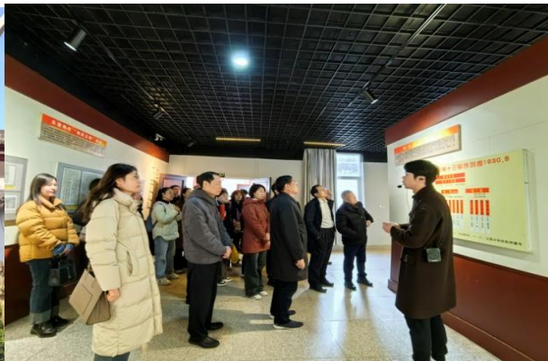
图 14. 党员在烈士纪念馆接受微党课教育 1