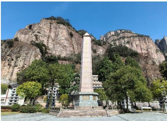
图 11. 雁荡山烈士陵园正面拍摄图片

工作会议结束后，党小组组织中华中医药学会血液病分会、中国民族医药学会血液病分会部分党员和入党积极分子开展了主题党日活动，参观雁荡山革命烈士陵园，并合影以示缅怀（图片 11-12）。